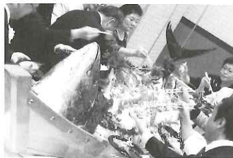
▲民紹協の懇親会の様子

業安定局長表彰、民紹協会会長表彰の表彰式が行なわれ、合計56名の方が受賞されました。