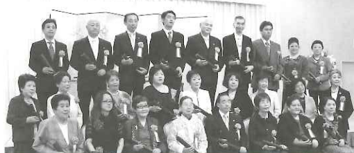
◀社団法人 全国民営職業紹介事業協会 会長「求職者」表彰を受賞された方々