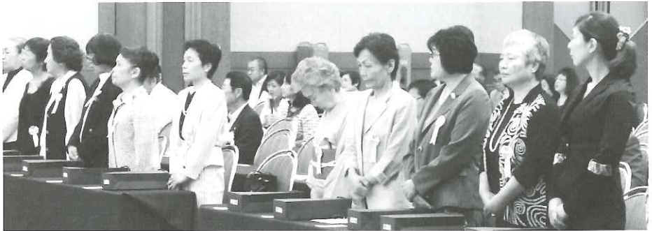
▲公益社団法人 日本看護家政紹介事業協会会長「求職者」表彰を受賞された方々