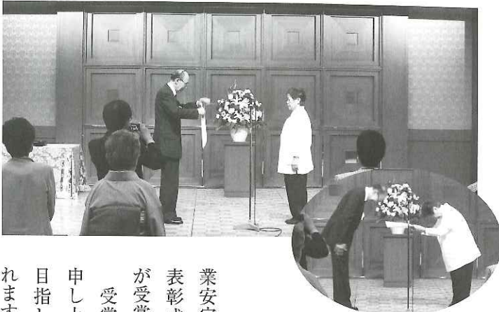
▲公益社団法人 日本看護家政紹介事業協会 会長「求職者」表彰表彰式の様子