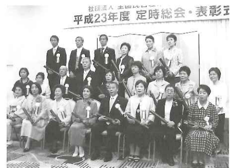
▲厚生労働省職業安定局長表彰を受賞された方々